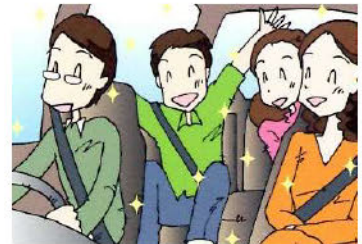
車両用クレベリン施工後イメージ