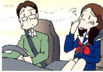
車両用クレベリン施工前イメージ