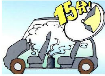
車両用クレベリン施工イメージ