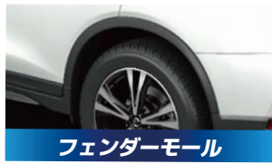
フェンダーモール 2,750円