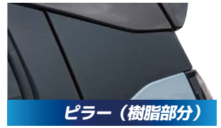
ピラー (樹脂部分) 1,100円