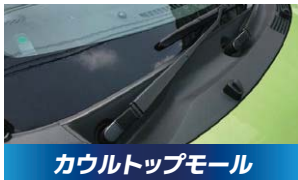
カウルトップモール 3,300円