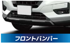
フロントバンパー 3,300円