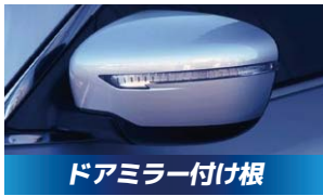
ドアミラー付け根 1,100円