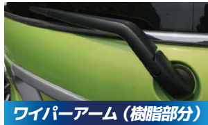
ワイパーアーム (樹脂部分) 1,100円