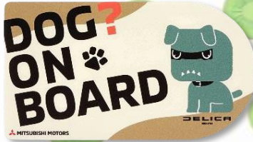
●「DOG? ON BOARD」 (TS14840)