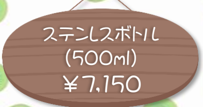
ステンレスボトル (500ml) ¥7,150

※表記の価格はすべて消費税込価格となります。*写真はイメージです。実際の商品とは仕様が異なる場合がございます。 *万が一品切れの場合はご容赦ください。*お手元に届くまでお時間を要する場合がございます。*詳しくはスタッフにおたずね下さい。