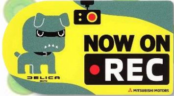
●「NOW ON REC」 (TS14842)