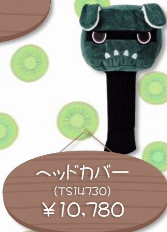
ヘッドカバー (TS14730) ¥10,780