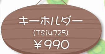
キーホルダー (TS14725) ¥990