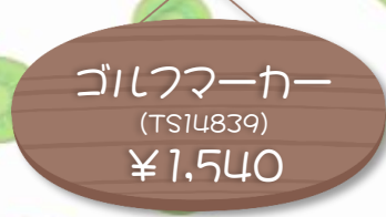
ゴルフマーカー (TS14839) ¥1,540