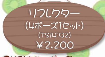
●1/10スケール ポーズ ジャンプ/ふせ/正面/おすわり