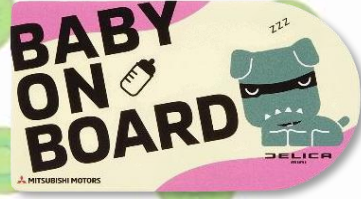
●「BABY ON BOARD」 (TS14841)